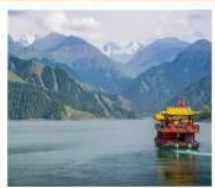
ช่องเรือทะเลสาบเทียนฉือ