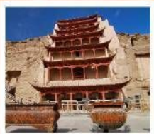
ถ้ำม่อเถา