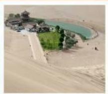
เป็นทรายหิมชานชาน