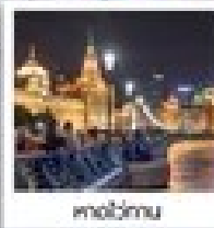
หวงเป่ย์