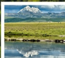
ดวงตาแห่งต่ำง

หมู่บ้านทิเบตเจียงจิว • จุดชมวิวกุหลาบหิมะหยา • ปาหลาง สวนหินปาหลาง • จุดชมวิวดวงตาแห่งต่ำง • วัดมู่หย่า หมู่บ้านเก๋ออี้หรือหม่าซุน • ซินตูเจียง • หมู่บ้านกู่หน่งซุน หมู่บ้านปาหลางเจียงตู • เมืองลอยฟ้าเก๋อตี้ลามู่ • ภูเขาจื่อตั่วซัน ถนนสายรุ้ง • ทะเลสาบแดง • ถนนคนเดินชอยกวางแคบ