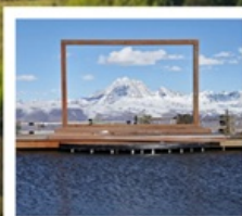
ปาหลางเจียงตู