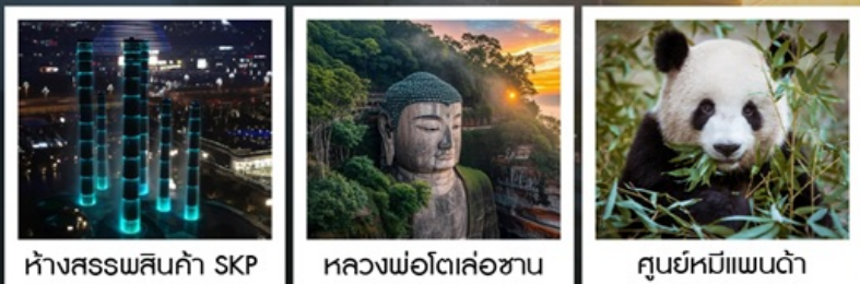
ห้างสรรพสินค้า SKP หลวงพ่อดีเล่อซาน ศูนย์หมีแพนด้า