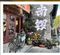
ถนนโบราณหนานหลิวกู่เซียง