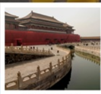
พระราชวังกู่กง