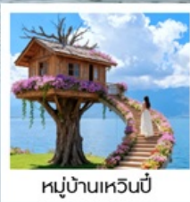
หมู่บ้านเหวินปี้

เมืองโบราณต้าหลี่ / นั่งเรือสู่เกาะเสี่ยวผู่โถว / ซานโตรินี่ (รวมรถแบบเตอร์) / ถนนทางแอร์ต้าต้า / ภูเขาอวิ้นเซียงซาน / ต้าซ่าท่าเรือหลงกัน โค้ง S ทะเลสาบเอ้อไห้ / หมู่บ้านโบราณสี่จิว / หมู่บ้านเหวินปี้ / ชมดอกไม้ตามฤดูกาล