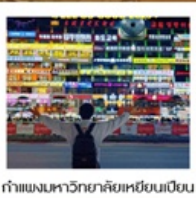
ก้าแพงมหาวิทยาลัยเหยียนเปียน