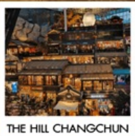
THE HILL CHANGCHUN