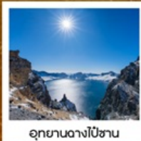
อุทยานอางไป่ซาน