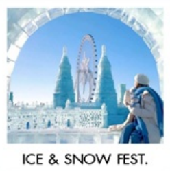
ICE & SNOW FEST.