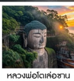
หลวงพ่อโตเล่อซาน