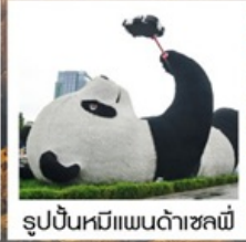
รูปปั้นหมีแพนด้าชิลลี่