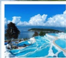
ซานโตรินี่ต้าหลี่

“เกาะเสี่ยวผู่...เกาะลึกลับกลางทะเลสาบ เอ้อไห้”