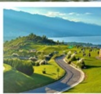
ภูเขาอวิ๋นเซียงซาน