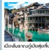
เมืองโบราณกู่เป่ย์ซู่เจิน