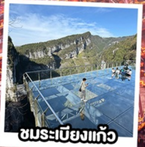
ชมระเบียบแก้ว