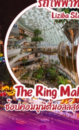
The Ring Mall