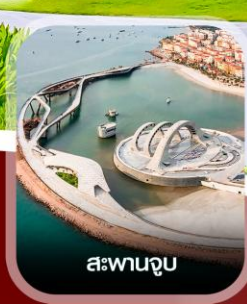
สะพานจูบ

✈️ คอนเฟิร์ม ออกเดินทาง ทุกพีเรียด 2 ท่านขึ้นไป