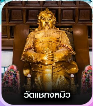
วัดเขาอกหมี