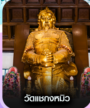
วัดเชกหงหมิว