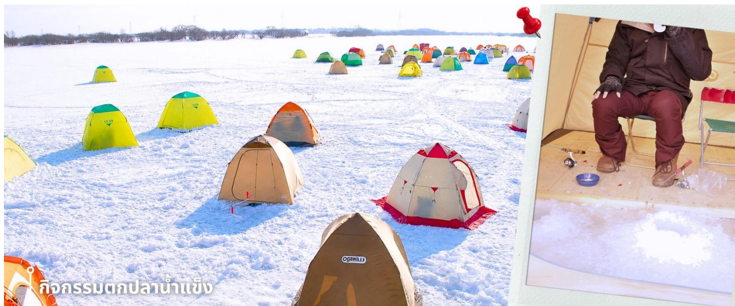
กิจกรรมตกปลาน้ำแข็ง

หลังรับประทานอาหารเที่ยง พาท่านทำกิจกรรมสุดฮิต กับ กิจกรรมตกปลาน้ำแข็ง (รวมค่าอุปกรณ์ตกปลา) กิจกรรมฤดูหนาวยอดนิยมของญี่ปุ่น กับการตกปลาน้ำแข็งท่ามกลางบรรยากาศธรรมชาติที่ปกคลุมด้วยหิมะสีขาว โดยในช่วงฤดูหนาว ผิวน้ำของทะเลสาบจะกลายเป็นแผ่นน้ำแข็งขนาดใหญ่ เปิดโอกาสให้นักท่องเที่ยวได้สัมผัสประสบการณ์ตกปลากลางอากาศหนาวแบบดั้งเดิมของญี่ปุ่น ท่ามกลางบรรยากาศหิมะสีขาวและอากาศหนาวเย็นแบบญี่ปุ่นแท้ ๆ ท่านจะได้ลองตกปลาด้วยตัวเองบนผืนน้ำแข็งขนาดใหญ่ พร้อมดื่มด่ำกับวิวธรรมชาติอันเงียบสงบ