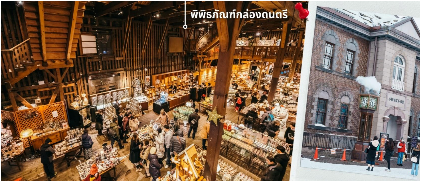
พิพิธภัณฑน์กล่องดนตรี

จากนั้นให้ท่านได้ชม หอนาฬิกาไอน้ำ ซึ่งตั้งอยู่ด้านหน้าพิพิธภัณฑน์ เป็นหอนาฬิกาขนาดใหญ่ที่รัฐบาลแคนาดามอบให้เป็นของขวัญแก่ประเทศญี่ปุ่น หอนาฬิกาแห่งนี้ ถูกตั้งเวลาให้ส่งเสียงออกมาทุกๆ15นาที และพ่นไอน้ำออกมาทุกๆชั่วโมง เหมือนเป็นจุดเช็คอินอีก1จุดของเมืองแห่งนี้ที่พลาดไม่ได้ จากนั้นให้ท่านได้ชม พิพิธภัณฑน์กล่องดนตรี ด้านในของพิพิธภัณฑน์มีพื้นที่กว้าง เป็นพิพิธภัณฑน์ที่มีเสน่ห์และเอกลักษณ์มากที่สุดอีกแห่งหนึ่งในญี่ปุ่น โดยพิพิธภัณฑน์แห่งนี้ตั้งอยู่ภายในอาคารอิฐเก่าแก่สูง 3 ชั้น ที่เดิมเคยเป็นโกดังเก่าแต่ถูกปรับปรุงจนกลายมาเป็นพิพิธภัณฑน์ ภายในเป็นสถานที่เก็บคอลเลคชั่นกล่องดนตรีที่ใหญ่ที่สุดแห่งหนึ่งของโลก ที่มีทั้งงานโบราณและงานร่วมสมัยใหม่ของยุโรป ญี่ปุ่น เก็บสะสมอยู่มากมาย มีทั้งขนาดเล็กและขนาดใหญ่นอกจากนี้ด้านในยังมีช่วงที่ เปิดโอกาสให้ผู้เยี่ยมชมสามารถทำกล่องดนตรีของตัวเองได้ ทั้งเลือกรูปแบบและการเลือกเมโลดี้เพลง เพื่อสร้างผลงานของตัวเองที่มีชิ้นเดียวในโลก และยังมีร้านค้าสำหรับขายกล่องดนตรีเพื่อซื้อเป็นของขวัญ ของที่ระลึกได้อีกด้วย