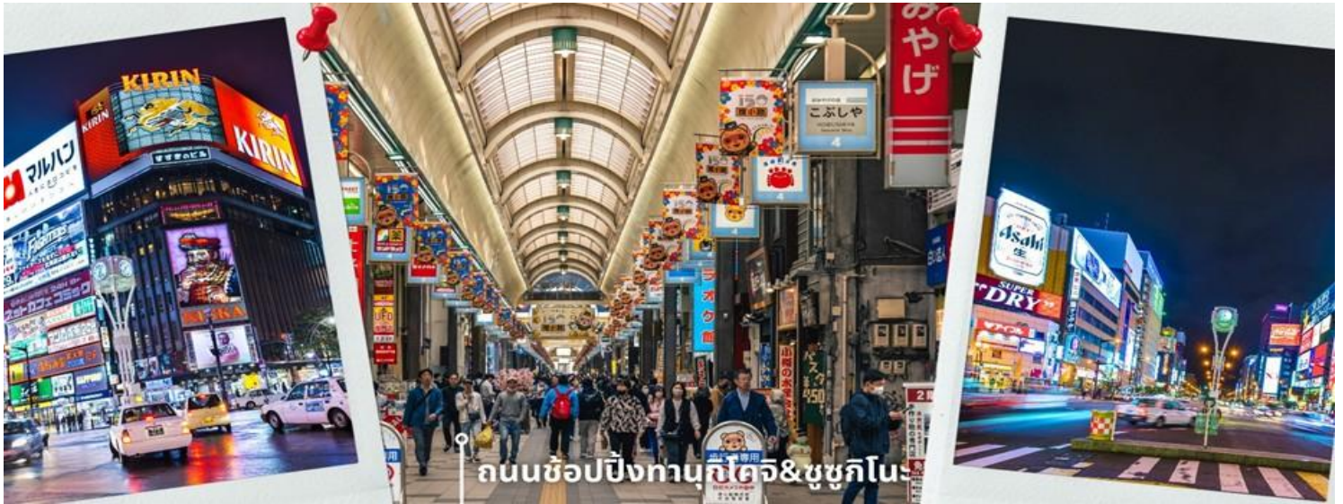
ถนนช้อปปิ้งทานุกิโคจิ&ชูชุกิโนะ

รายล้อมด้วยภูเขาและป่าสนที่ปกคลุมด้วยหิมะขาวโพลน กิจกรรมนี้ถือเป็นอีกหนึ่งเสน่ห์ของการท่องเที่ยวฤดูหนาวที่ผสมผสานทั้งความสุข ความตื่นเต้น และบรรยากาศสุดพิเศษไว้ในช่วงเวลาเดียวกัน เหมาะสำหรับผู้ที่ต้องการสัมผัสประสบการณ์ใหม่ ๆ พร้อมเก็บภาพความประทับใจท่ามกลางวิวหิมะสุดอลังการ พอสมควรแก่เวลา นำท่านเดินทางสู่ ถนนช้อปปิ้งทานุกิโคจิ เป็นถนนช้อปปิ้งที่ตั้งอยู่แทบจะใจกลางเมือง Sapporo โดยมีร้านค้า ร้านอาหาร ห้างสรรพสินค้า ร้านเกม และโรงแรม รวมกันมากกว่า 200 เรียงรายยาวตั้งแต่ทิศตะวันตกยันทิศตะวันออกยาวถึง 1 กิโลเมตร และยังมีบันไดเลื่อนลงไปทางเดินใต้ดินอีกด้วย ซึ่งทางเดินใต้ดินก็ยังมีร้านค้า ร้านอาหารอีกมากมายด้วยเช่นกัน ถนนช้อปปิ้งแห่งนี้เป็นที่มาของเทศกาลแห่ขบวนตลอดทาง ดังนั้นแล้วไม่ว่าจะฝนตก หิมะตก หรือแดดแรง ก็ยังสามารถเดินช้อปปิ้งที่ถนนแห่งนี้ได้เหมือนเดิม และย่านชูชุกิโนะ เป็นย่านช้อปปิ้งและบันเทิงใหญ่ที่สุดในซัปโปโร ตั้งอยู่ใจกลางเมืองและตั้งอยู่บริเวณรอบๆสถานีรถไฟใต้ดินชูชุกิโนะ อยู่ห่างไปไม่กี่กิโลจากสวนสาธารณะโอโดริประมาณ 500เมตรและอยู่ไม่ไกลจากถนนทานุกิโคจิ ย่านนี้เป็นที่นิยมของทั้งคนท้องถิ่นและนักท่องเที่ยว ย่านนี้เต็มไปด้วยร้านค้ามากมาย ทั้งสินค้าแฟชั่น สินค้าแบรนด์เนม ของฝาก ของที่ระลึก และสินค้าอุปโภคบริโภคต่างๆ รวมถึงสถานบันเทิงยามค่ำคืน ให้เวลาท่านได้เดินช้อปปิ้งตามอัธยาศัย