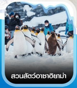
สวนสัตว์อาซาฮยาม่า