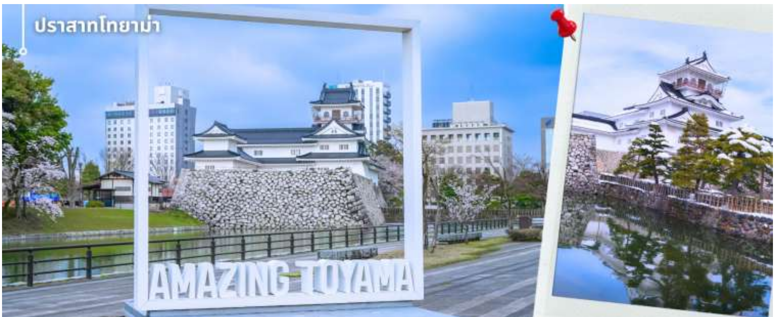
ปราสาทโทยาม่า

หลังจากรับประทานอาหารเที่ยง นำท่านเปลี่ยนบรรยากาศเข้าสู่ เมืองโทยาม่า เป็นเมืองที่มีเสน่ห์จากการผสมผสานระหว่างธรรมชาติและวัฒนธรรมได้อย่างลงตัว โดยมีฉากหลังเป็นเทือกเขาแอลป์ญี่ปุ่นอันยิ่งใหญ่ และมีชื่อเสียงด้านอาหารทะเลสดจากอ่าวโทยาม่า ซึ่งได้รับการยกย่องว่าเป็นหนึ่งในอ่าวที่อุดมสมบูรณ์ของญี่ปุ่น บรรยากาศภายในเมืองมีความสะอาด เป็นระเบียบ และเงียบสงบ สะท้อนวิถีชีวิตแบบญี่ปุ่นท้องถิ่นได้อย่างชัดเจน ภายในเมืองยังมีเส้นทางรถรางที่เป็นเอกลักษณ์ วิ่งผ่านย่านสำคัญต่าง ๆ เพิ่มเสน่ห์ให้กับทัศนียภาพของเมืองได้อย่างลงตัว นำท่านเดินทางไปที่ปราสาท Toyama Castle (ด้านนอก) แลนด์มาร์คทางประวัติศาสตร์อันเป็นสัญลักษณ์ของเมือง โดยนำท่านชมความสวยงามทางสถาปัตยกรรม ซึ่งโดดเด่นด้วยกำแพงหินสีขาวสะอาดตัดกับสีเขียวของสวนสวยรอบตัวปราสาท ท่านจะได้ชื่นชมความวิจิตรของบ่อน้ำพุร้อนที่สะท้อนเงาบนผิวน้ำในคูเมืองอย่างงดงาม พร้อมเดินเล่นถ่ายภาพปราสาทจากสวนสาธารณะที่ล้อมรอบปราสาทโทยาม่า ภายในพื้นที่มีทั้งคูน้ํา แนวต้นไม้ และพื้นที่สีเขียวที่จัดไว้อย่างเป็นระเบียบ บริเวณสวนสามารถมองเห็นตัวปราสาทสีขาวที่ตั้งโดดเด่นอยู่ท่ามกลางทัศนียภาพโดยรอบได้อย่างสวยงาม ซึ่งในแต่ละฤดูกาลจะมอบบรรยากาศที่แตกต่างกันไป มอบความรู้สึกสงบและอืมเอมไปกับเรื่องราวในอดีตที่ยังคงได้รับการรักษาไว้อย่างสมบูรณ์ท่ามกลางความทันสมัยของเมืองโทยามะ พร้อมทั้งให้ท่านได้ถ่ายรูปกับจุดไฮไลต์ภายในสวน Amazing Toyama จุดที่ท่านจะสามารถมองเห็นปราสาทโทยาม่าได้อย่างสวยงามตระการตา