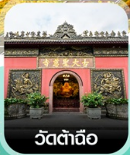
วัดต้าดิ้อ