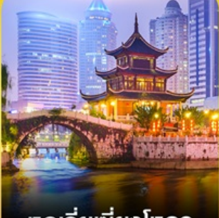
หอเจียเซียงโหลว