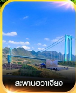
สะพานฮวาเจียง