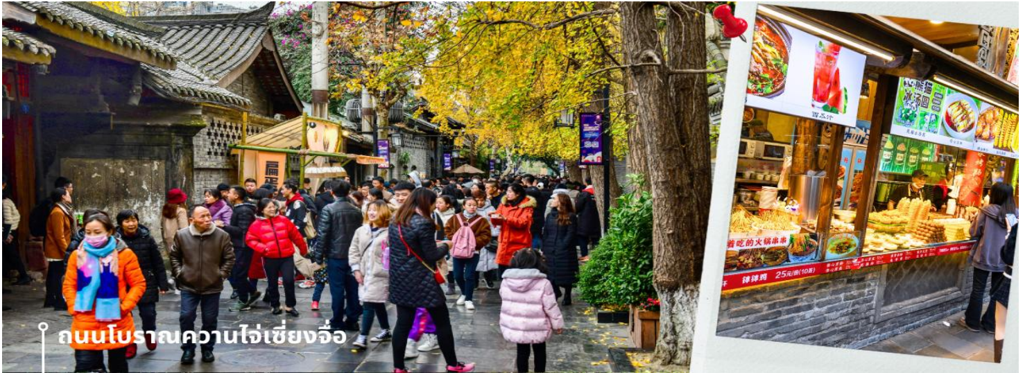
ถนนโบราณความใจเซียงจี้

หลังรับประทานอาหารเช้า นำท่านเดินทางสู่ ความใจเซียงจี้ หรือเรียกว่า ซอยกว้างซอยแคบ เป็นถนนที่ยังคงอนุรักษ์เสน่ห์ ความสวยงาม และ วิถี ชีวิตการเป็นอยู่ ของคนจีนชาวเฉิงตูในสมัยโบราณมาอย่างยาวนาน อีกทั้งยังผสมผสานกับยุคปัจจุบันเอาไว้ได้อย่างลงตัว ภายในบริเวณมีอยู่ 2 ซอย คือ ซอยกว้าง และ ซอยแคบ จึงเป็นที่มาของชื่อนี้ แต่ละซอยมีความยาวประมาณ 400 เมตร มีร้านค้าใหญ่เล็กเรียงรายตลอดซอย ทั้งร้าน ชา กาแฟ หนังสือ เสื้อผ้าชุดเซ็กซี่ของวัยรุ่นเจ้าถิ่น เฉิงตู “ตงเจียว จี้” 东郊记忆 (Eastern suburb Memory) ที่มีทั้งแกลลอรี่ คาเฟ่ น่ารักๆ มากมาย และร้านเสื้อผ้า ร้านค้าเก่าๆ ให้เราได้เดินช้อปปิ้งเพลินๆ แลรมีจุดถ่ายรูป ตลอดทั้งถนน และร้านอาหาร