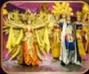
ชมชุดออกโรงละครธา