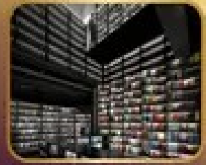
ชมร้านหนังสือ