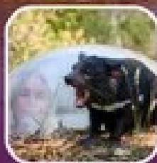
ชม Tasmanian Devil ที่ซิดนีย์