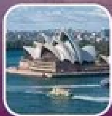
ชมเมืองซิดนีย์จากน้ำ