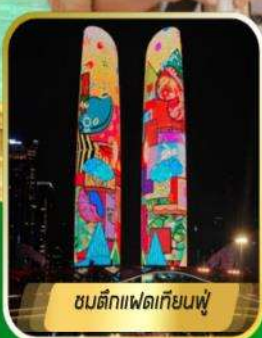
ชมตึกแพนด้าเทียนฟู่