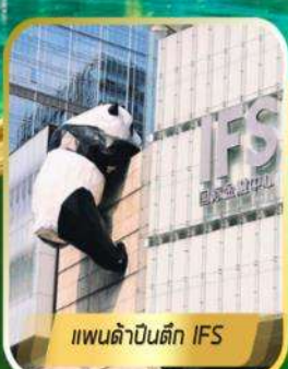
แพนด้าปีนตึก IFS