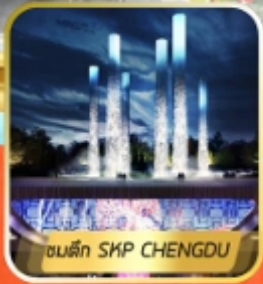
ตึก SKP CHENGDU