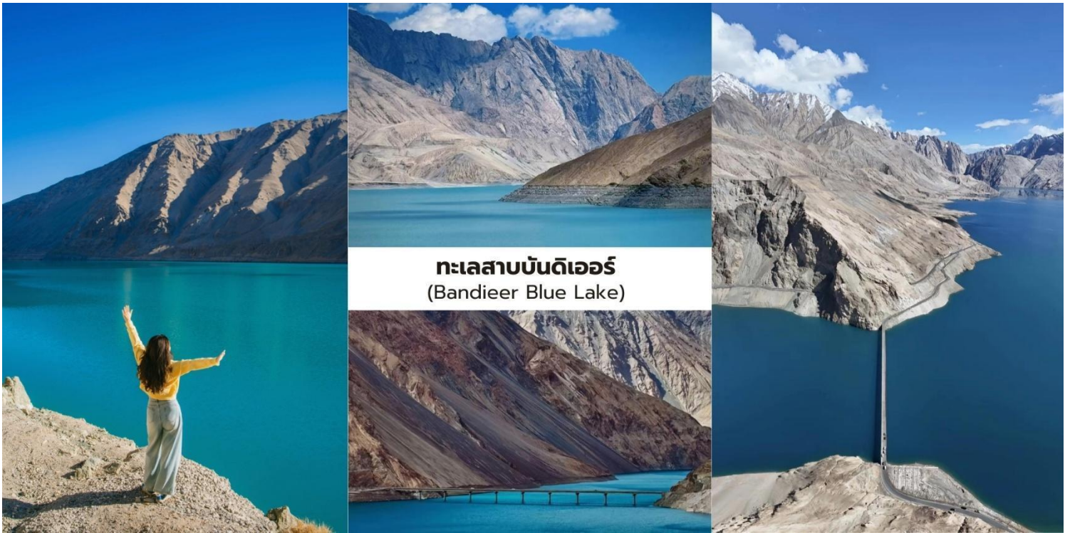
ทะเลสาบบันดิเออร์ (Bandieer Blue Lake)

จากนั้นนำท่านเปลี่ยนการเดินทางในช่วงนี้โดยใช้ รถยนต์ 7 ที่นั่ง ตามที่กำหนด เพื่อให้สามารถลัดเลาะไปตามเส้นทางภูเขาที่คดเคี้ยวได้อย่างสะดวกและปลอดภัย นับเป็นอีกหนึ่งประสบการณ์การเดินทางบนถนน ภูเขาที่มีเอกลักษณ์ที่สุดแห่งหนึ่งของเส้นทางท่องเที่ยวในจีนเฉียง