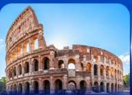
เข็ควินดัง โคลอสเซียม โรม