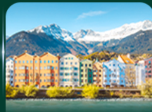
อาคารสีลูกกวาด อินส์บรุค