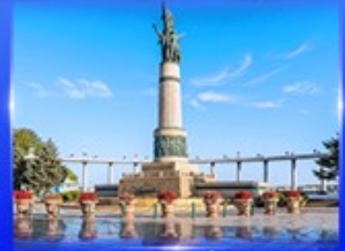
อนุสาวรีย์นิ่ผิง