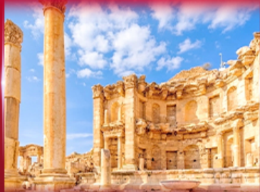
เมืองโบราณเจราช