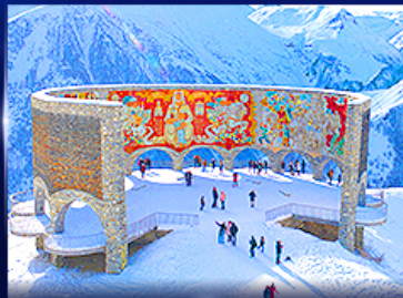
อนุสาวรีย์มิตรภาพ รัสเซีย-จอร์เจีย