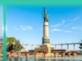
อนุสาวรีย์นิงหง