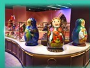
พิพิธภัณฑ์ ตุ๊กตาเปลูกอด