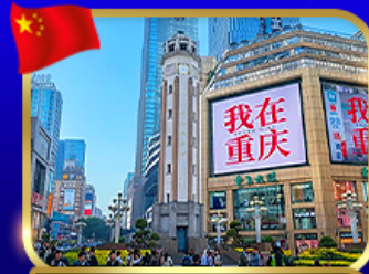
ถนนคนเดินริยฟางเป่ย