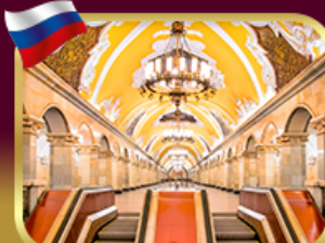
สถานีรถไฟใต้ดินกรุงมอสโก