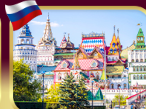
อิสมาลอฟสกีมาร์เก็ต