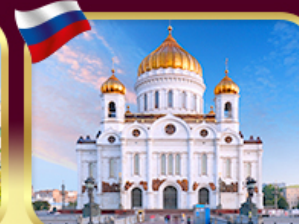
มหาวิหารเซนต์ซาเวียร์