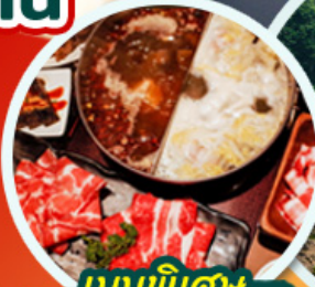
เมนูพิเศษ ชาบูหม่าล่า