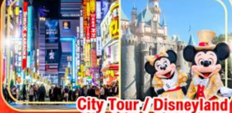
City Tour / Disneyland