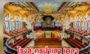
โรงละครปาลาเดอเดลา มูสิคก้า คาตาลานา