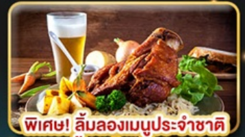
พิเศษ! ลิ้มลองเมนูประจำชาติ ทั้ง 5 ประเทศ!!!