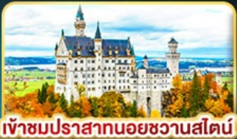
เข้าชมปราสาทนอยชวานสไตน์

คัดสรรความเป็น "ที่สุด" ของยุโรปตะวันออกครบถ้วน