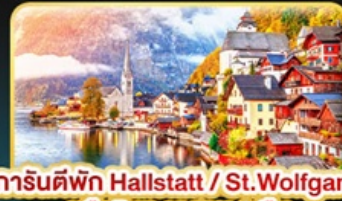
การันตีพัก Hallstatt / St. Wolfgang หรือริมนทะเลสาบ 1 คืน