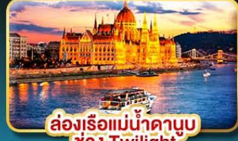
ส่องเรือแม่น้ำดาบুব ช่วง Twilight