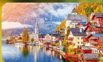
การันตีพัก Hallstatt / St. Wolfgang หรือริมทะเลสาบ 1 คืน