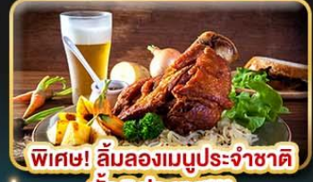
พิเศษ! ลิ้มลองเมนูประจำชาติ ทั้ง 5 ประเทศ!!!