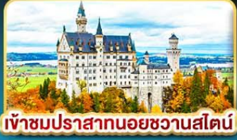
เข้าชมปราสาทนอยชวานสไตน์

คัดสรรความเป็น "ที่สุด" ของยุโรปตะวันออกครบถ้วน