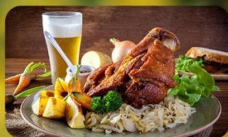
พิเศษ! ลิ้มลองเมนูประจำชาติ ทั้ง 5 ประเทศ!!!