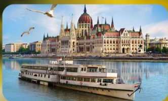
ล่องเรือแม่น้ำดาบูบ พร้อมจิบแชมเปญ