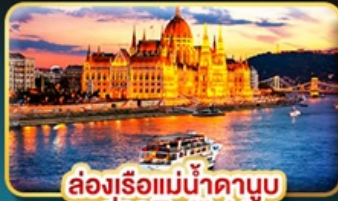
ส่องเรือแม่น้ำดานูบ ช่วง Twilight