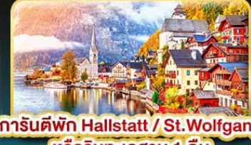
การ์นต์พัก Hallstatt / St. Wolfgang หรือริมทะเลสาบ 1 คืน