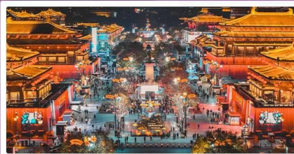
ถนนวัฒนธรรมราชวงศ์ถัง