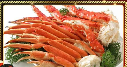
เมนูพิเศษ!! ซูฟุพังงปูยักษ์ 3 ชนิด