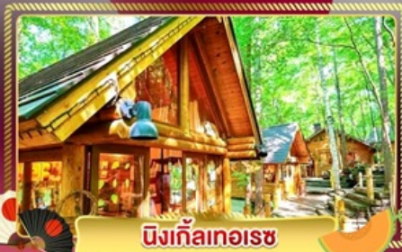
นิงเกิลทอเรซ

ชมทุ่งลาเวนเดอร์ และทุ่งดอกไม้ขึ้นชื่อของฮอกไกโด ฟาร์มโทมิตะ และ ชิโกะไซโนะโอะกะ