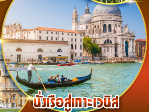
นั่งเรือสู่เกาะเวนิส