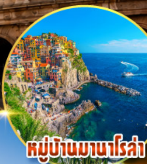
หมู่บ้านมานาโรซ่า

พิเศษ ลิ้มรสป่าร์มาแฮมถึงเมืองต้นกำเนิดแท้ๆ