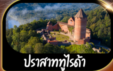
ปราสาทตุโรดำ

GO3HEL-EK001 28 ธ.ค.69 - 07 ม.ค.70 เทศกาลปีใหม่