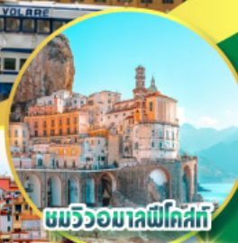
ชมริ้วมาลฟีโกสตี