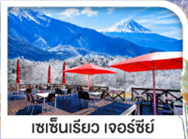
เซชินเรียว เจอร์ซีย์

หมู่บ้านมรดกโลกชิราคาวาโกะ | ชมวิวฟูจิ ริมทะเลสาบคาวากูจิ เซชินเรียว เจอร์ซีย์ ระเบียงชมวิวภูเขาไฟฟูจิและเทือกเขาแอลป์