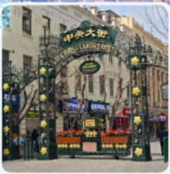
ถนนจงยาง