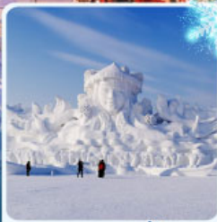
งานแกะสลัก เกาะพระอาทิตย์