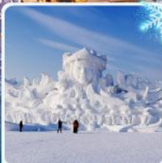
งานแกะสลัก เกาะพระอาทิตย์