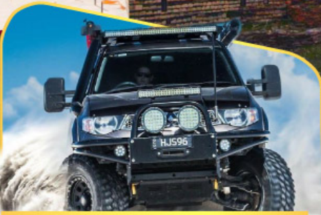
ขึ้นรถ 4WD สู้ใจกลางเทือกเขาคอเคซัส