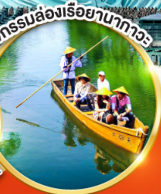
กิจกรรมล่องเรือยานากาวะ