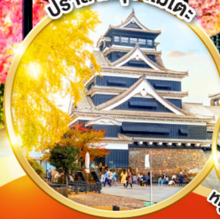
ปราสาทคูมาโมโตะ