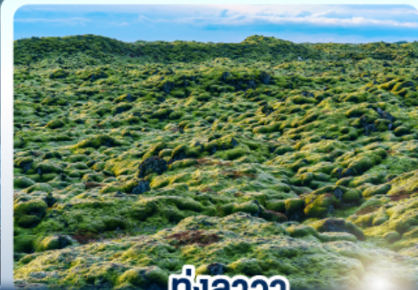
ทุ่งลาวา