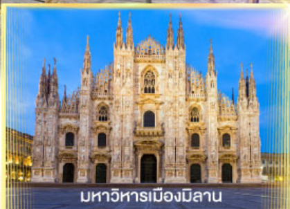
มหาวิหารเมืองมิลาน