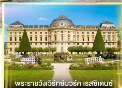
พระราชวังเวิร์ทซ์บวร์ค เรสซิเดนซ์