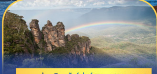
อุทยานแห่งชาติบลูเมาท์เทนส์ Three Sister Rock