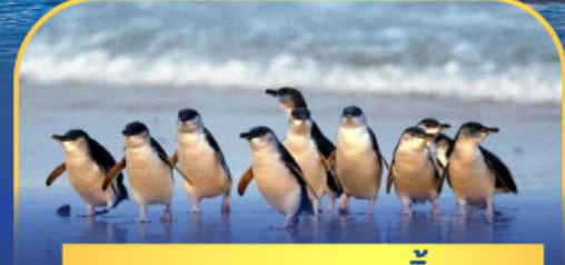
พาหรดนกเพนกวิน